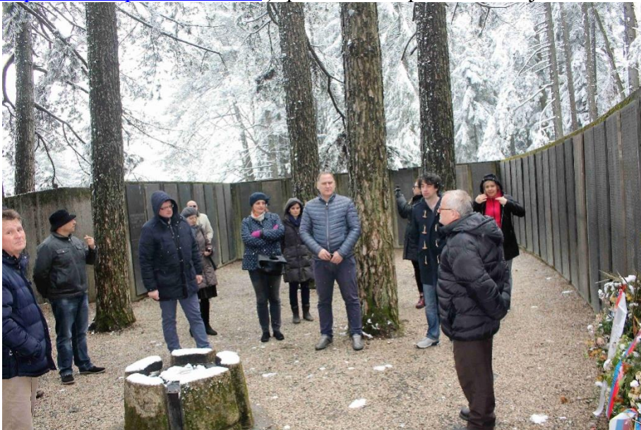
Sl.4. Poseta spomen parku

kulturnog nasleđa " u okviru kogasu obišli, okolno selo Piskavicu i KUD "Piskavica" ( http://folklorepiskavica.com/ ) i prisustvovali prikazu običaja Krsna slava.