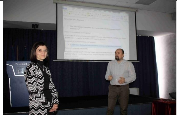
Sl.2-3. Rad u grupama i predstavljanje rezultata rada svake od grupa