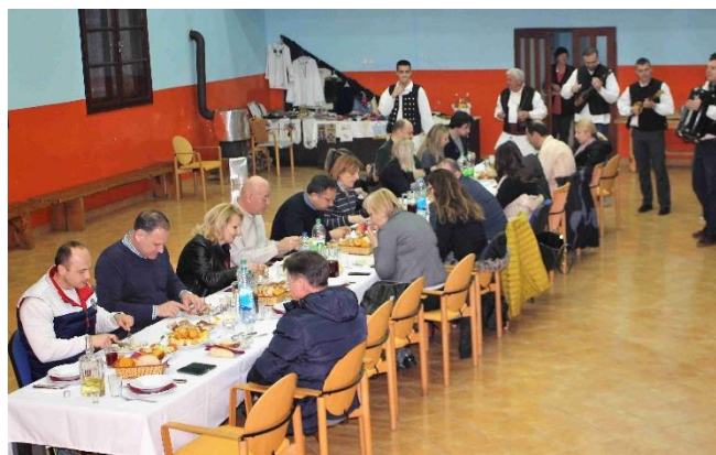
Sl.5-6. Scenski prikaz krsne slave i svečana večera